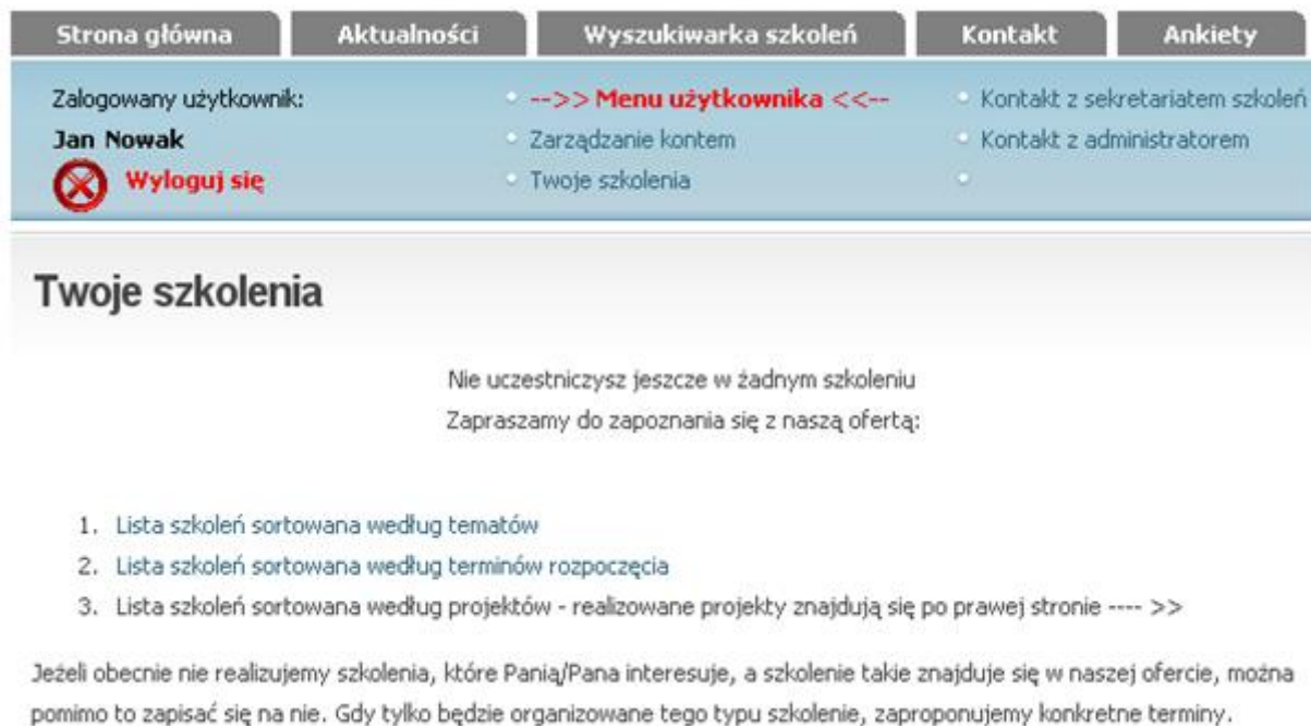
Rysunek 59. Okno konta Jana Nowaka

Po zalogowaniu się użytkownik ma możliwość zarządzania swoim kontem (zmiana hasła, danych kontaktowych). Jeśli jest to pierwsze logowanie, należy koniecznie uzupełnić dane dotyczące zatrudnienia.