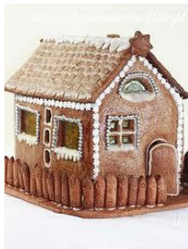
Jaś i Małgosia